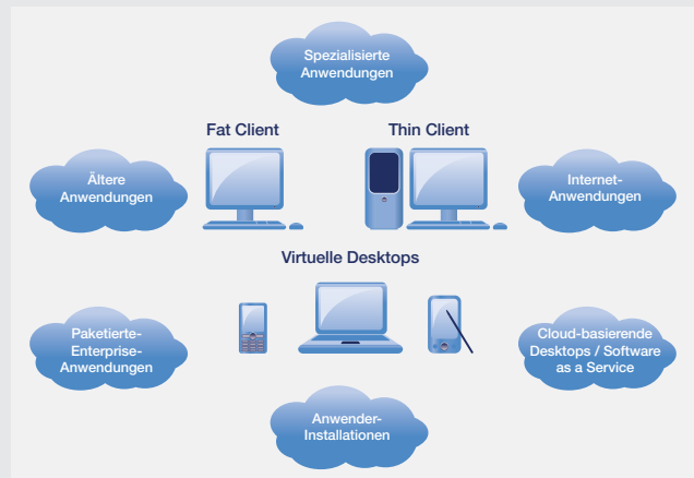
Vielschichtig: Die Applikations-Landschaft im Unternehmen

Die IT-Abteilung mag sich über die reichhaltige Virtualisierungs-Speisekarte freuen, den Entscheidern macht sie oft Bauchschmerzen. Welche Technik ist nun die richtige? Soll die ganze virtuelle Umgebung auf einer einzigen Plattform standardisiert werden? Wie kann man mobile User sinnvoll einbinden? Oder solche, die offline arbeiten müssen?