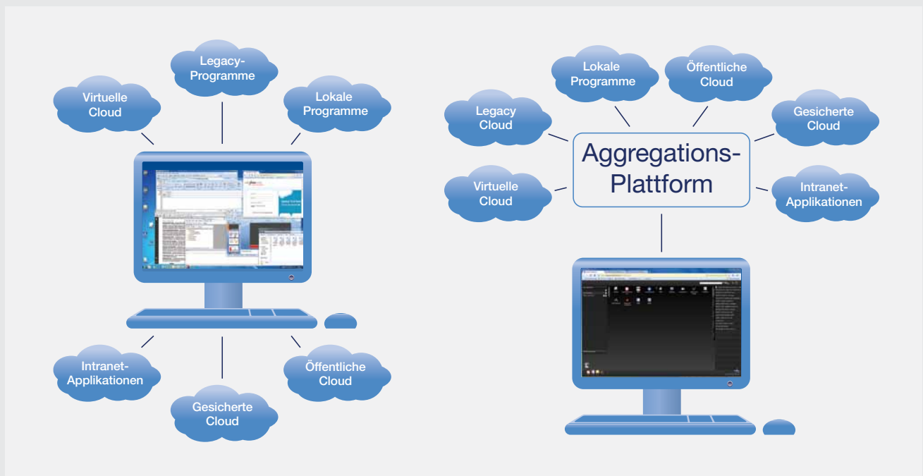
Verwirrend: Services ohne Aggregation

WorkSpace Universal baut eine einfache Web-basierende Benutzeroberfläche auf, mit der je nach Zugangsberechtigung verschiedenste Services zugänglich sind. Mit WorkSpace Universal wird auch die Verwaltung sehr komfortabel. Eine Applikation wird einfach einem User oder einer User-Gruppe zugeordnet und ist dann ohne umständliche Installation sofort über das Browser-Fenster verfügbar.