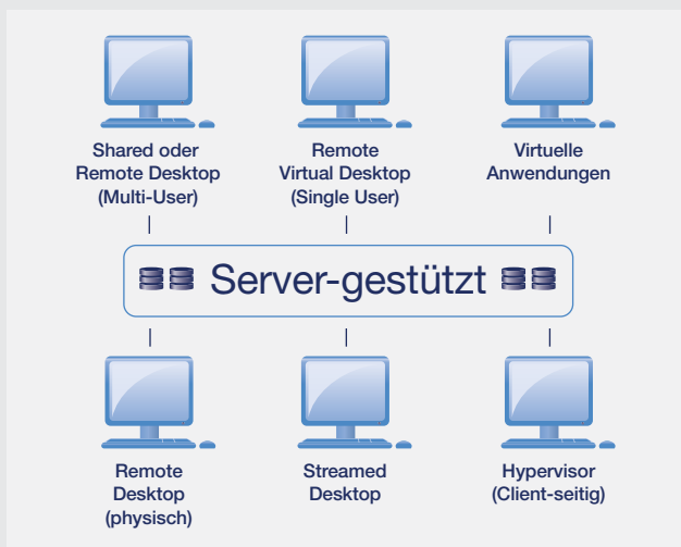
Reichhaltig: Eine kleine Auswahl an Strategien bei der Desktop-Virtualisierung

So unterschiedlich wie die Anforderungen der Nutzer sind auch die Technologien, die jeweils am besten zum Anwendungsfall passen. Einige User sind mit Streaming- oder Server-Applikationen am besten beraten, andere mit einem lokalen Systemzugang. Wieder andere brauchen anspruchsvolle Grafik für ihre Arbeit. Und dann gibt es ja auch noch den Mix aus geschäftskritischen Legacy-Systemen und Web-Anwendungen zu bedenken – nicht alles lässt sich so einfach in einen virtuellen Desktop portieren.